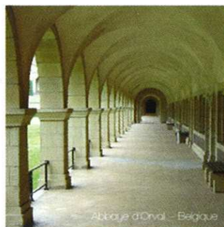
Abbaye d'Onval - Belgique