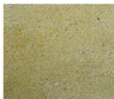
Jaumont Banc Lacour

Couleur : beige Masse volumique apparente : 2396 kg/m 3 Porosité : 9,9% Essai de gel : non gelive pour 240 cycles Résistance à la compression : 53,9 MPa Résistance à la flexion : 8 MPa Résistance aux attaches : 1080 N Usure au disque métallique : 28,1 mm