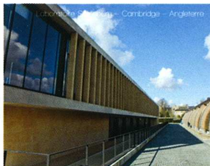
Laboratoire S. - Cambridge - Angleterre